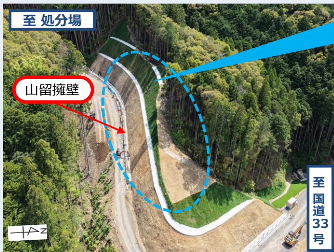
進入道路工事の整備状況（令和8年5月12日撮影）

国道33号から400m付近では、引き続き擁壁工事が進んでいます。また、植生シートを設置した斜面では、緑が広がり、周辺の樹木と馴染んでいます。