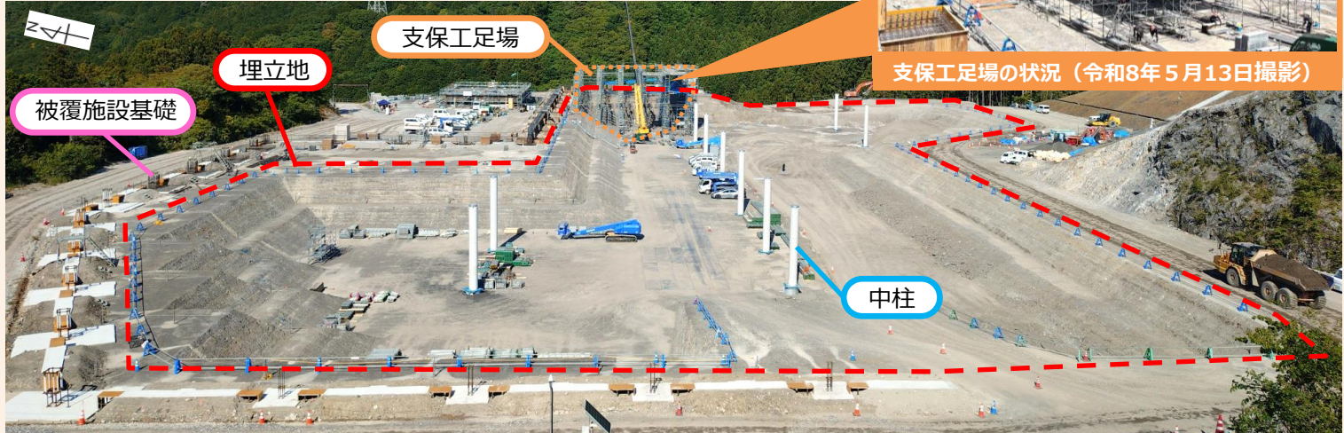
支保工足場の状況（令和8年5月13日撮影）

施設本体では、施設の屋根を支える支保工足場の組み立てが始まりました。また、被覆施設の基礎工事も進み、建物の大まかな形が見えてきました。