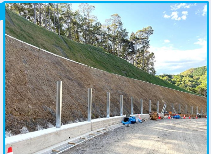
擁壁工事の状況（令和8年5月13日撮影）