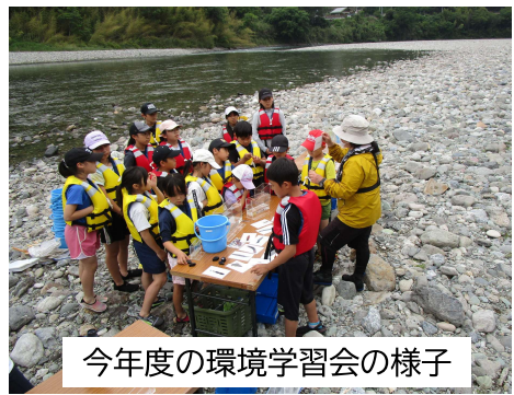
今年度の環境学習会の様子

活動の内容については、環境保全等連絡協議会でのご意見等をふまえ、決定していく予定です。