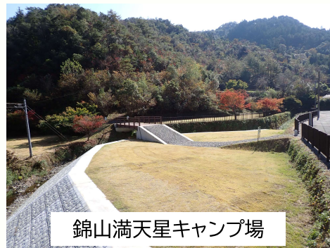
錦山満天星キャンプ場